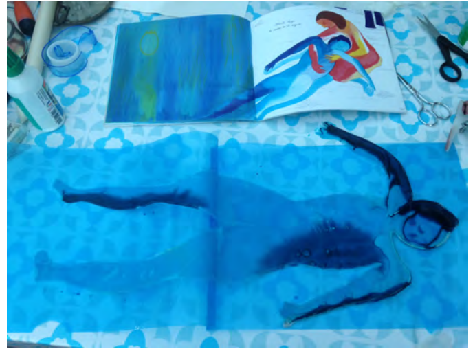
De l'album à la scène

Ce premier conte se jouera en deux dimensions, les personnages de l'album sont recréés en soie et seront peints sur scène. Ils évolueront sur un écran de papier cachant mon corps afin que l'on ne voit que mes bras et mon visage nus.