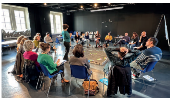
Atelier « Circulation artistique »