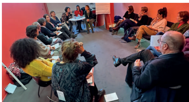
Atelier « Relations et solidarités interprofessionnelles »