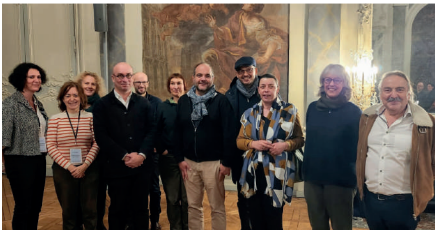
Membres de Scènes d'enfance - ASSITEJ France, du TiGrE, de la DGCA, de la FNCC et élu·es de la Ville de Nancy, à l'Hôtel de Ville