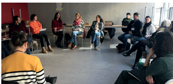
Atelier « EAC et droits culturels »