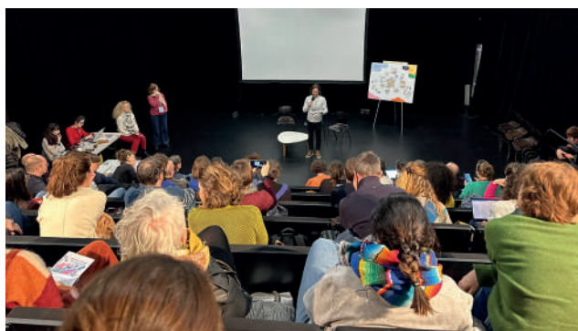
Restitution des ateliers