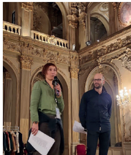
Carte blanche du TiGrE