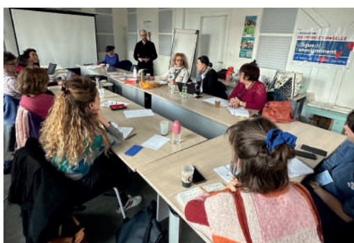
Atelier « Mise en place des réunions de concertation »